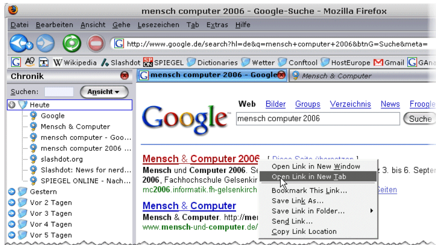
Abb. 1: Links die History („Chronik“), oben der Bookmark-Toolbar und rechts oben zwei Tabs des Browsers

sing“ (s. Abb. 1) und „Mausgesten“ (vgl. Moyle & Cockburn 2003), die aber noch immer nicht für alle Benutzer verfügbar sind oder spezielle Erweiterungen voraussetzen.